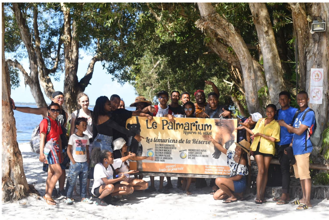
Photo N° 01 : Photo de groupe après la visite de la réserve du Palmarium