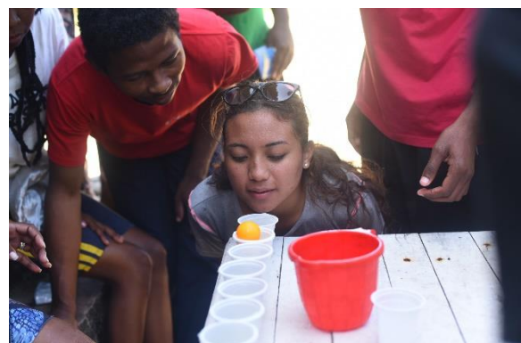
Photo N° 08-09-10-11 : Pendant la team building – Divers jeux