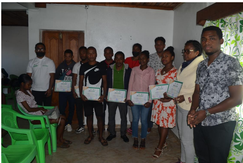
Photos N° 09 : Durant la remise officielle des attestations, le 30 juillet 2022