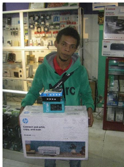
Photos N° 07 et N° 08 : Deux bénéficiaires des kits d'une valeur globale de 125 €