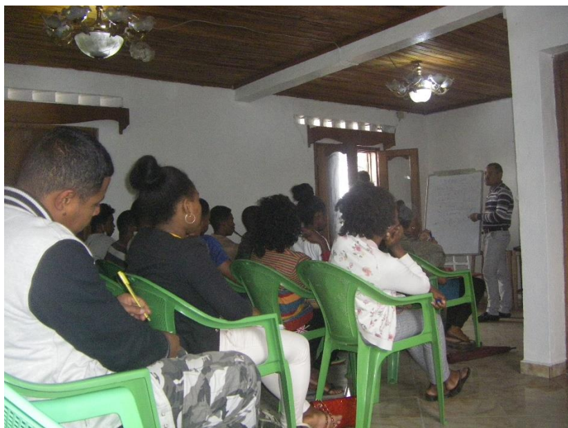
Photo N° 02 : Formation en éducation financière au siège de l'ONG JADE

Après cette étape, les bénéficiaires ont reçu différentes formations d'appui. Une fois les formations achevées, Jade a passé à la signature des contrats de prêt pour la formalisation du projet. Ensuite, c'était le tour de la livraison du matériel correspondant à l'activité de chaque bénéficiaire (cette partie logistique a été assurée par le responsable du projet MIVELOGNA avec le concours du responsable logistique du projet), suivi d'une phase d'accompagnement équivalant à la période de remboursement du tiers des toutes les dépenses cumulées par tête (3 mois).