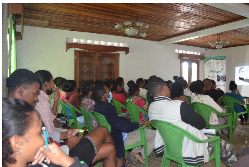
Photo N° 01 : Formation en développement personnel au siège de l'ONG Jade

En ce sens, ce sont surtout des bénéficiaires qu'ont pu satisfaire les critères exigés par le projet (assiduité durant les différentes formations proposées, acceptation d'un remboursement d'un tiers de la totalité des dépenses engendrées par tête) qui paraissent dans la liste de bénéficiaires du programme.