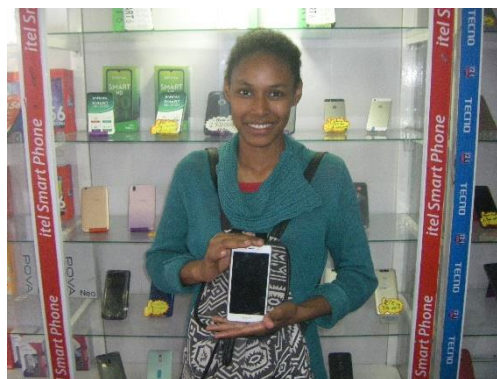
Photos N° 05 et N° 06 : Deux bénéficiaires des kits pour le travail en ligne d'une valeur globale de 50 €