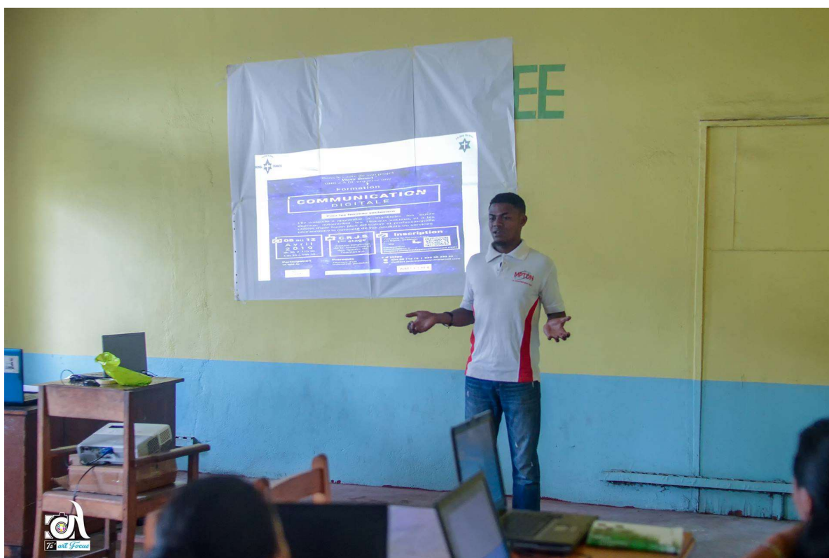
Photos 2 : Discours et présentation par le Responsable TICs du MPTDN