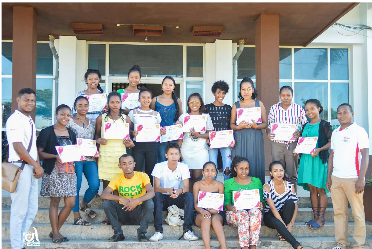
Photo14: Photo de groupe après la remise des attestations – Représentants du MPTDN, formatrice, membres de l'ONG Jade et les Viav Smart de la deuxième édition